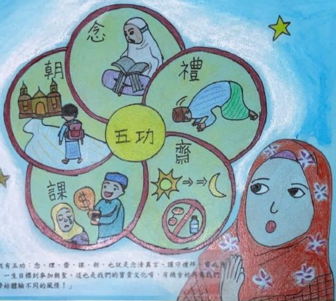
伊斯蘭教有五功：念、禮、齋、課、朝，也就是念清真言、謹守禮拜、實戒月 施捨和一生目標到參加朝聖。這也是我們的寶貴文化呀，有機會給再來我們 國家，帶妳體驗不同的風情！」