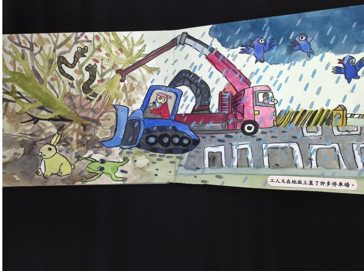
工人又在地面上蓋了許多停車場。