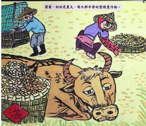
爺爺、奶奶是農夫，每天都辛勞的整理農作物。