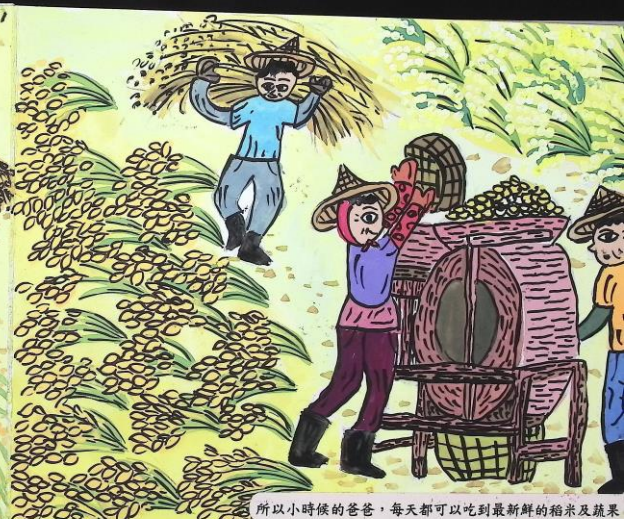
所以小時候的爸爸，每天都可以吃到最新鮮的稻米及蔬果